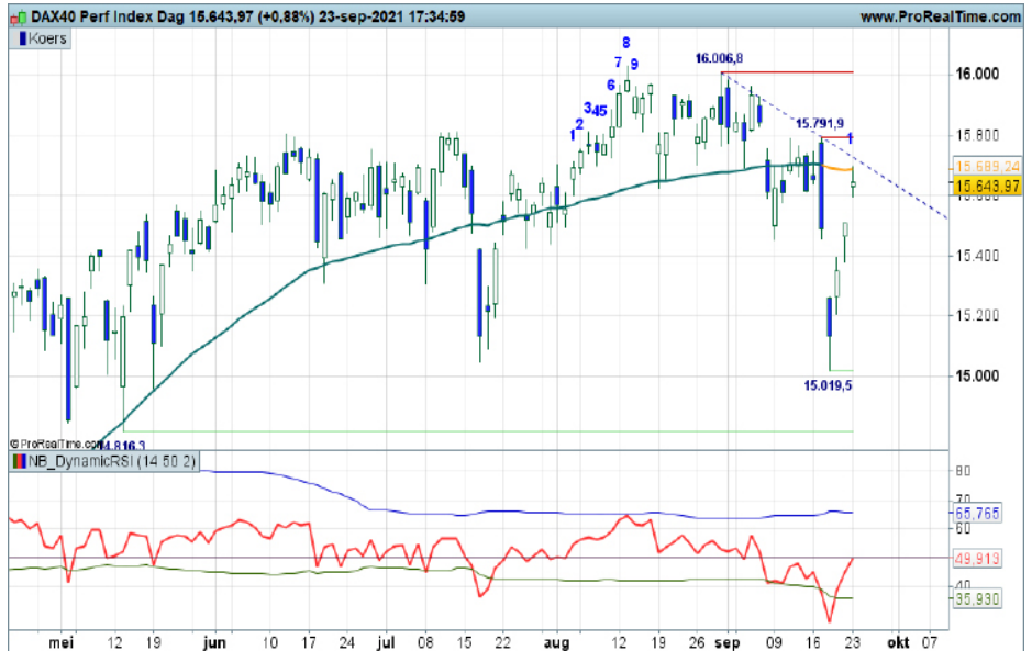
Grafiek uit ProRealTime Software

Coaching: reboundposities zijn mogelijk tot er signalen van topvorming ontstaan. Een strak exit management ter overweging.