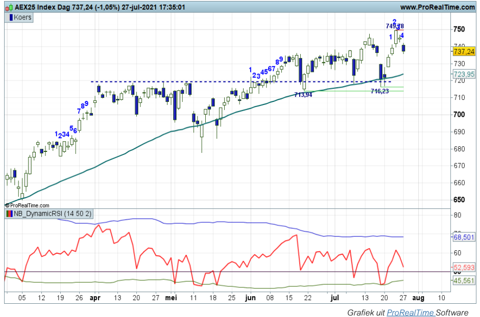
Grafiek uit ProRealTime Software

Conditie: Up. Coaching: bij meer berendruk koopposities verkleinen. Bij een witte candle zijn er additionele koopkansen.