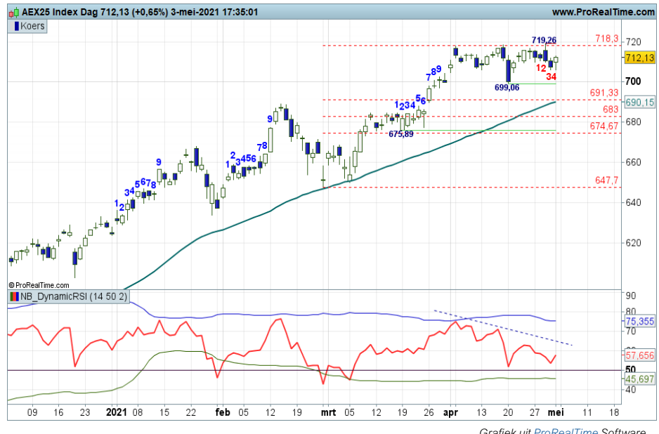
Grafiek uit ProRealTime Software

Conditie: Correctie. Coaching: voor range spelers is het een uitdagende chart, voor trendbeleggers niet.