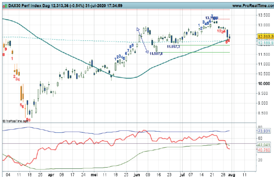
Grafiek uit ProRealTime Software

Conditie: Correctie Coaching: na een correctie wellicht offensieve aankoopkansen. 'Wachten op wit' is daarbij de overweging.