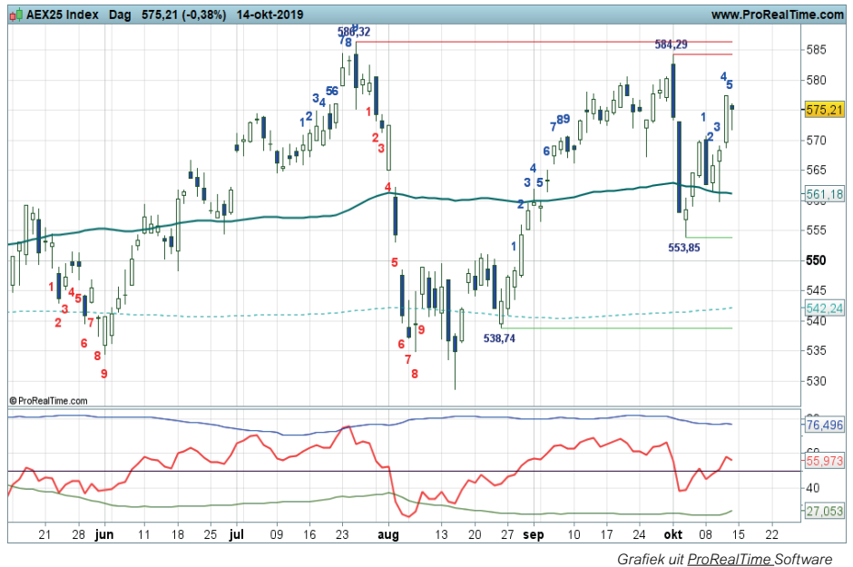
Grafiek uit ProRealTime Software

Coaching: koopposities mogen worden aangehouden. Hou rekening met extra aanloopjes, ‘kopen op zwakte’ lijkt de aangewezen strategie.