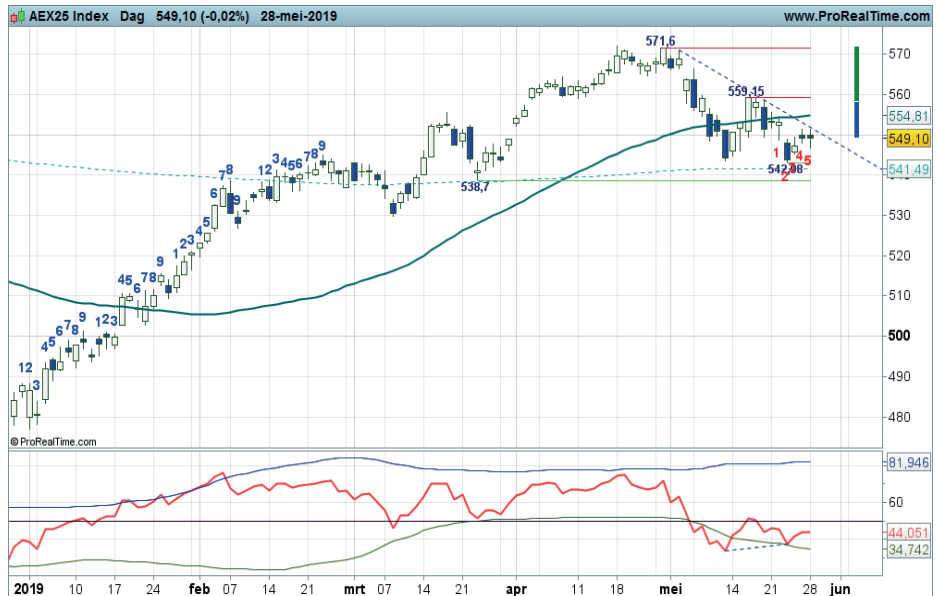
Grafiek uit ProRealTime Software

Coaching: offensieve rebound posities strak bewaken. Nieuwe kansen bij een witte candle en een positieve swingteller.