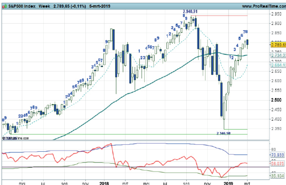
Grafiek uit ProRealTime Software

Coaching: wellicht wat winst verzilveren.