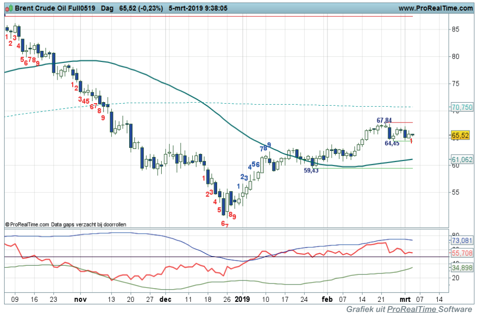
Daggrafiek BrentOil

Coaching: Na dips wellicht nieuwe koopkansen.