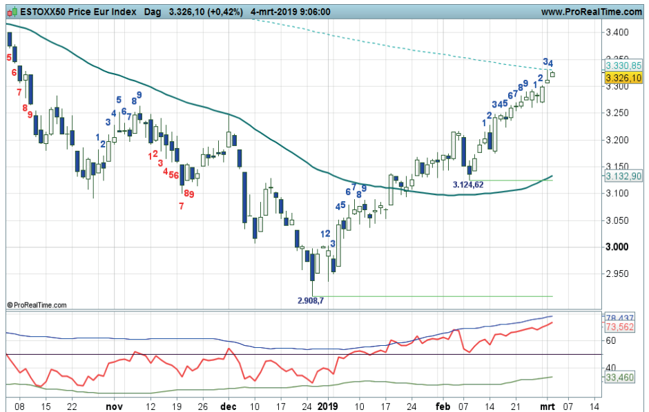
Grafiek uit ProRealTime Software

Coaching: trendbeleggers kunnen koopposities aanhouden zolang de swingteller positief telt.