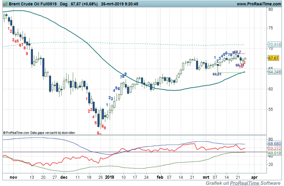
Daggrafiek BrentOil Bron: BTAC Visuele Analyse, 26 maart 2019

Conditie: Resistance (correctie). Coaching: offensieve koopposities zijn gerechtvaardigd.