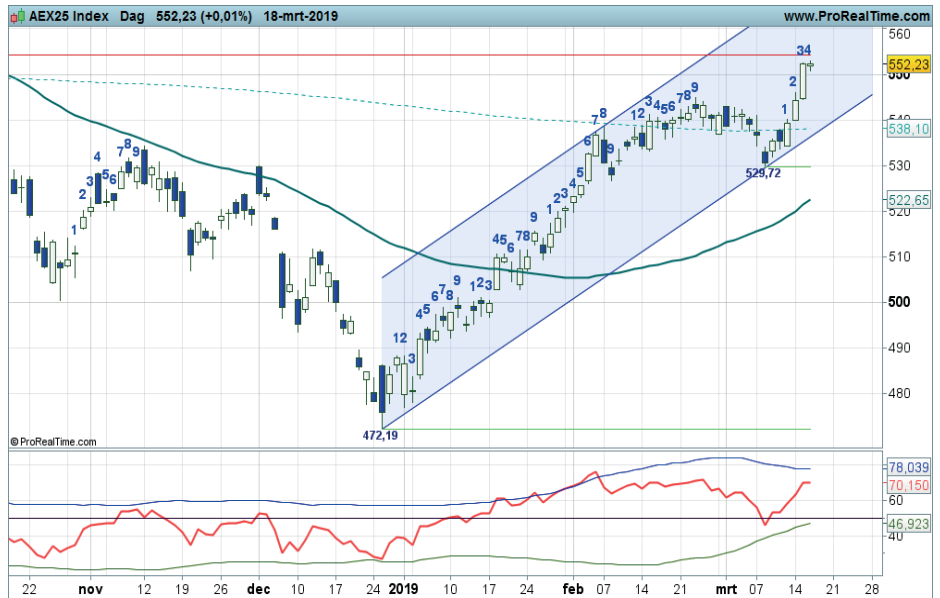
Grafiek uit ProRealTime Software

Coaching: koopposities kunnen worden aangehouden. Bij zwarte candles rond de weerstand wellicht wat winst nemen.