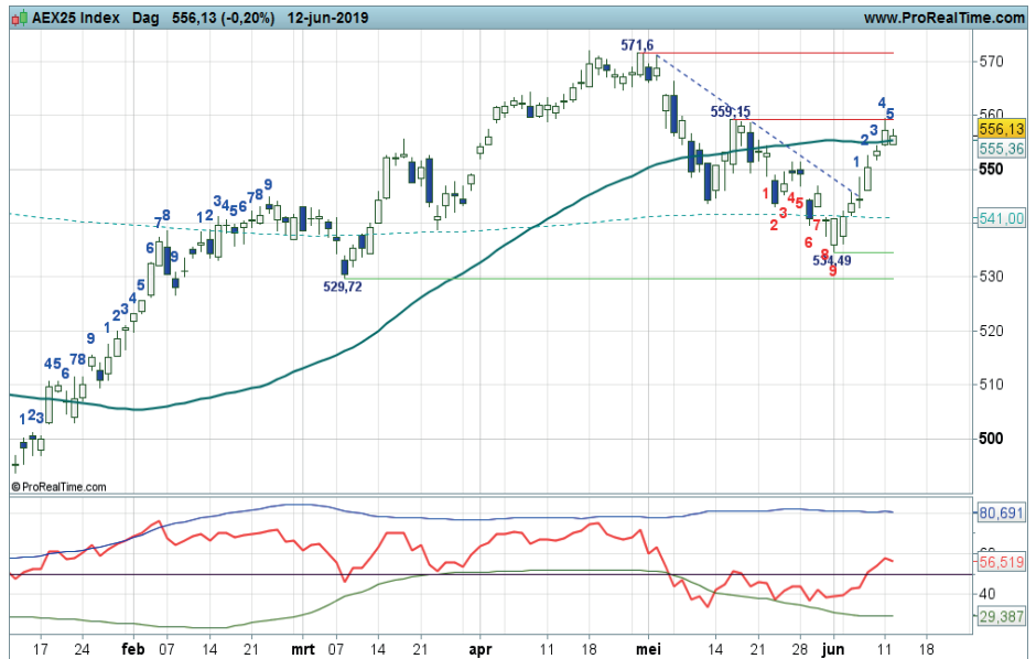
Grafiek uit ProRealTime Software

Coaching: bij zwarte candles wellicht wat winst nemen op bestaande koopposities.