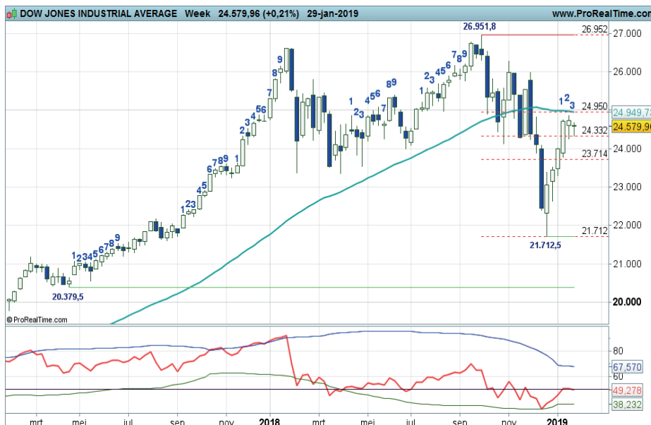
Grafiek uit ProRealTime Software

Conditie: Support (herstel). Coaching: reboundspelers kunnen posities aanhouden zolang de candles wit blijven. Bij haperingen wellicht wat winsten zekerstellen.