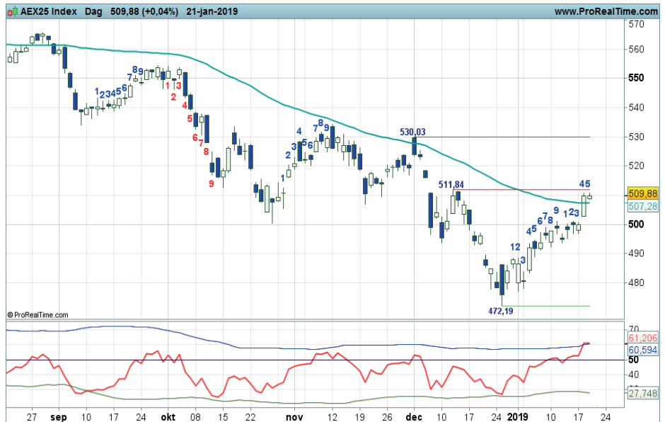
Grafiek uit ProRealTime Software

Coaching: bescheiden koopkansen zijn waarneembaar. Hou de strijd bij de SMA scherp in de gaten, strak navigeren is gewenst als er posities uitstaan.