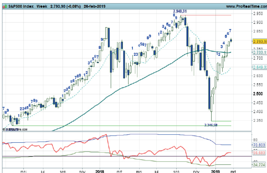
Grafiek uit ProRealTime Software

Coaching: koopposities kunnen worden aangehouden. Bij zwarte candles wellicht wat afbouwen.