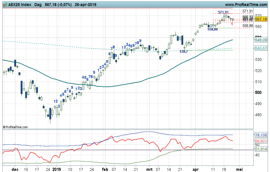
Grafiek uit ProRealTime Software

Conditie: Resistance (Correctie). Coaching: het is te overwegen om met een strak money management uitstaande koopposities te bewaken.