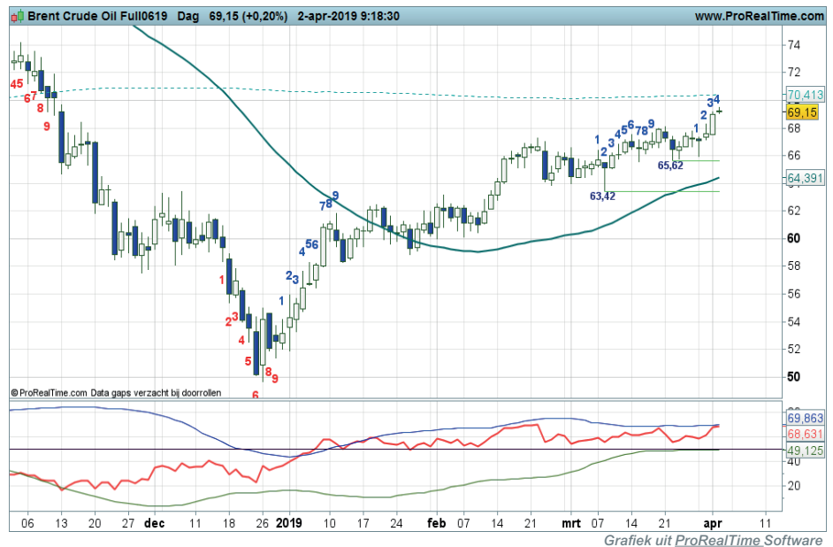
Grafiek uit ProRealTime Software

Conditie: Up. Coaching: trendbeleggers overwegen koopposities aan te houden.