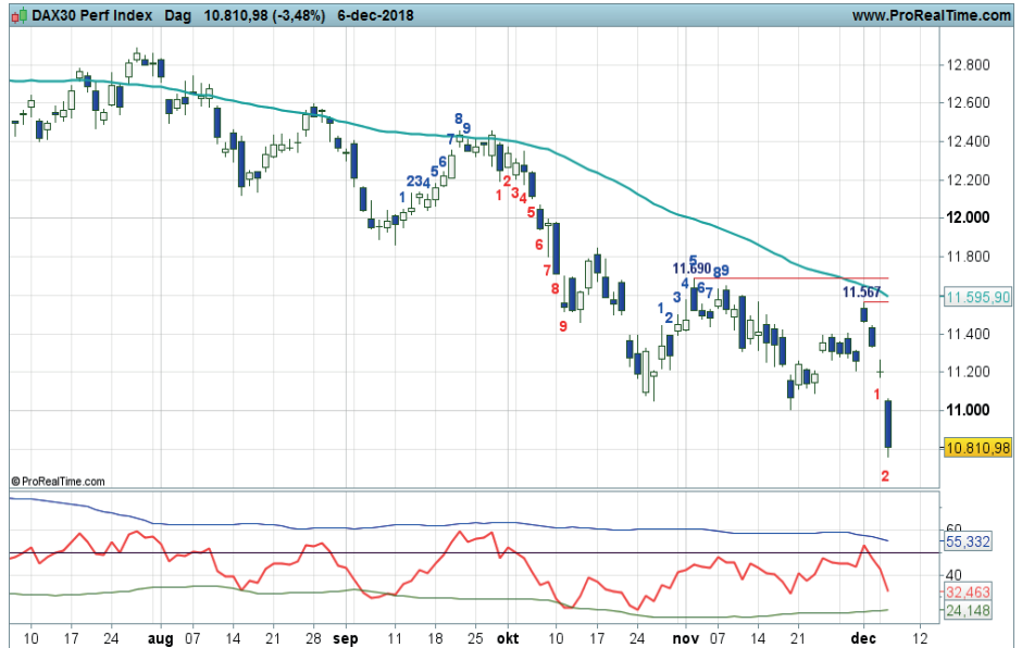
Grafiek uit ProRealTime Software

Coaching: shortspelers kunnen profiteren van de afdaling zolang de swingteller negatief telt.