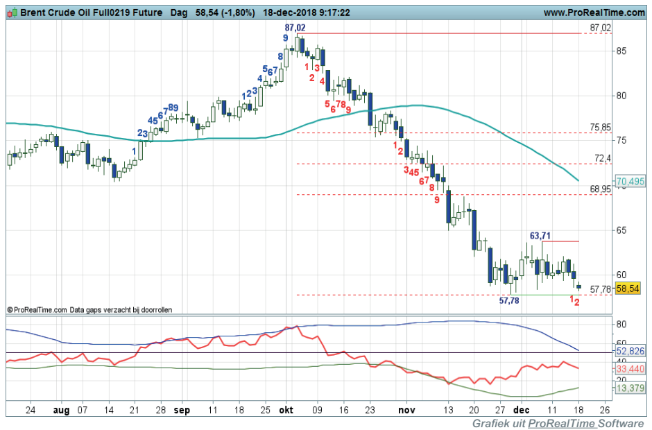
Daggrafiek BrentOil Bron: BTAC Visuele Analyse, 18 december 2018

Coaching: Onder 57,78 krijgt de dalende trend een vervolg en krijgen shortspelers nieuwe kansen.