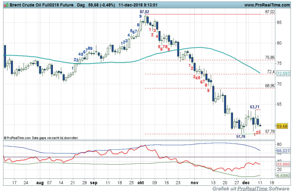
Daggrafiek BrentOil

Coaching: reboundspelers kunnen overwegen posities af te bouwen. Onder 57,78 krijgt de dalende trend een vervolg.