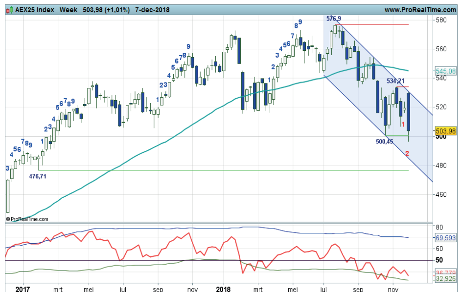
Grafiek uit ProRealTime Software

Coaching: short spelers mogen hun posities aanhouden zolang de candles zwart kleuren en de swingteller doortelt in het rood.