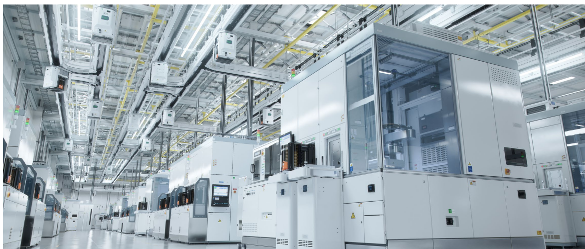
Bronnen: Investor Relations, ABN Amro, Yahoo Finance en Forbes.